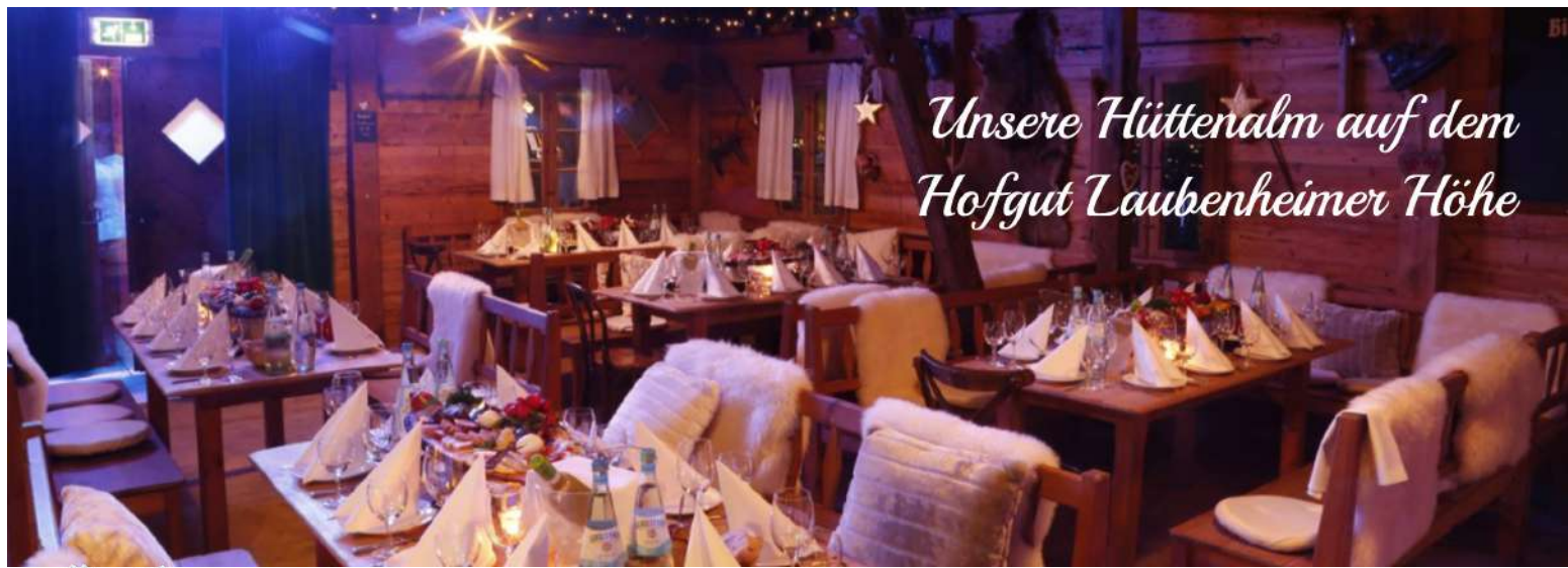
Unsere Hüttenalm auf dem Hofgut Laubenheimer Höhe